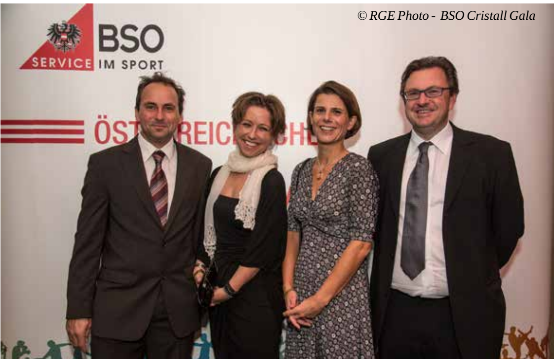
BSO Cristall Gala