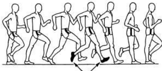
Fehler, weil kein Bodenkontakt