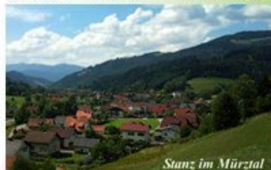
Stanz im Mürztal